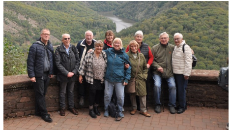
An der Cloef: Bild vom Treffen im Oktober 2024.

Wir bitten um Meldung im Gemeindebüro (Tel. 06831 2470) oder bei Helmut Bauer (Tel. 06831 84708), der die Fahrt organisiert.