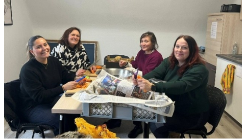
Gemüse schnippeln für den guten Zweck

Für die Aktion übernahm das Team von Cum-iNo die gesamte Organisation – vom Einkauf über das Kochen bis hin zum Transport der Speisen. In gemeinsamer Arbeit wurde eine Kürbissuppe für rund 80 Portionen zubereitet. Das hierfür verwendete Gemüse stammte aus der Gärtnerei des Vereins für Sozialpsychiatrie. Ergänzt wurde das Menü durch Baguette aus Frankreich und Pudding als Nachtisch. Nach der Zubereitung wurden die Speisen in Behälter abgefüllt und nach Saarbrücken gebracht, wo das Kältebusteam sie am Abend ausgab.