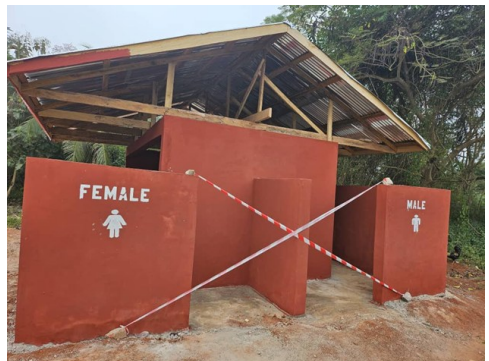
Nachher: Spendenfinanzierte Toilettenanlage.

zen will, aber auch jede Einzelspende ist willkommen.