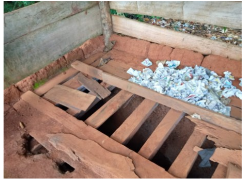
Vorher: Nur eine einzige Latrine am Ort.

Wir freuen uns über jeden neuen Paten, der regelmäßig mit seinem Beitrag Kinder und Jugendliche in Indien unterstüt-